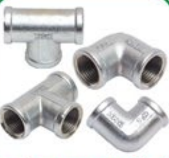
स्टे. स्टील पाईप फीटिंग