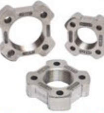
स्टे. स्टील जोटो (जोईन्ट)