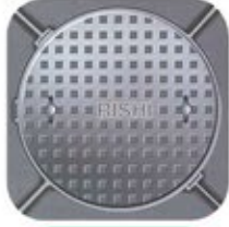
मेनहोल कवर राउन्ड