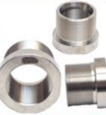
स्टे. स्टील स्टेप नीपल