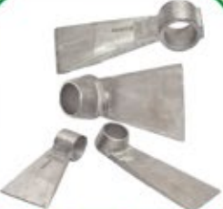
स्टे. स्टील कुहाकी / खुदाकी

रीषी कास्ट प्रा. ली. कंपनी मारफत सन १९९१ से आयरन और स्टील की अलग-अलग प्रोसेस मारफत जैसे की ग्रे कास्ट आयरन, डकटाईल आयरन/S.G. आयरन, स्टे. स्टील कास्टिंग जैसी कास्टिंग की अलग-अलग प्रोसेस, ग्रीन सेन्ड कास्टिंग, सेल मोल्डींग कास्टिंग, इन्वेस्टमेन्ट कास्टिंग मुताबीज "रीषी" ब्रान्ड के उत्पादन मेनहोल कवर, गेरेज झाली, कप्लींग, फ्लांज, बोरकेप, बेसीन ब्रेकेट, आदी तरह तरह की मेटल से बनाया हुआ पाईप फीटिंग के कवोलीटी पार्टस असेसरीज बनाया जाता है।