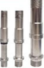
कोलम पाईप असेसरीज़