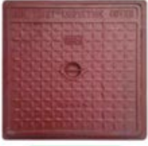
मेनहोल कवर स्क्वेर