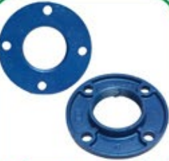
डकटाईल आयर्न फ्लांज