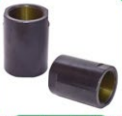
डकटाईल आयर्न कपलींग