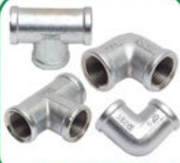
स्टे. स्टील पाईप फीटींग