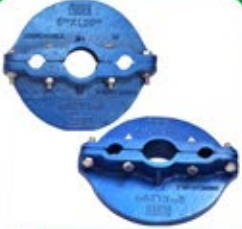
डकटाईल आयर्न बोरकेप