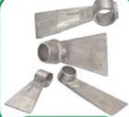
स्टे. स्टील कुहाकी / खुदाकी

रीषी कास्ट प्रा. ली. कंपनी मारफत सन १९९१ से आयर्न और स्टील की अलग-अलग प्रोसेस मारफत जैसे की ग्रे कास्ट आयर्न, डकटाईल आयर्न/S.G. आयर्न, स्टे. स्टील कास्टिंग जैसी कास्टिंग की अलग-अलग प्रोसेस, ग्रीन सेन्ड कास्टिंग, सेल मोल्डींग कास्टिंग, इन्वेस्टमेन्ट कास्टिंग मुताबीज "रीषी" ब्रान्ड के उत्पादन मेनहोल कवर, गेरेज झाली, कप्लींग, फ्लांज, बोरकेप, बेसीन ब्रेकेट, आदी तरह तरह की मेटल से बनाया हुआ पाईप फीटींग के कवोलीटी पार्टस असेसरीज बनाया जाता है।