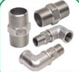
स्टे. स्टील पाईप फीटींग