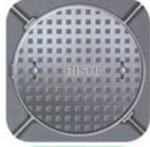
मेनहोल कवर राउन्ड